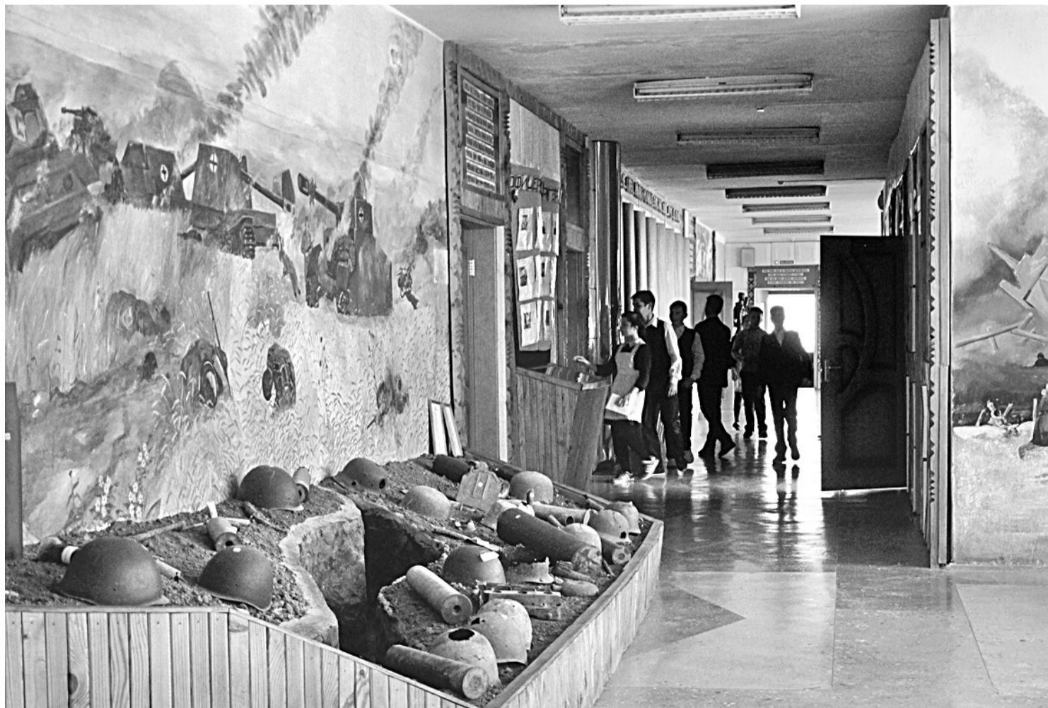
Школьный музей Великой Отчужденной войны