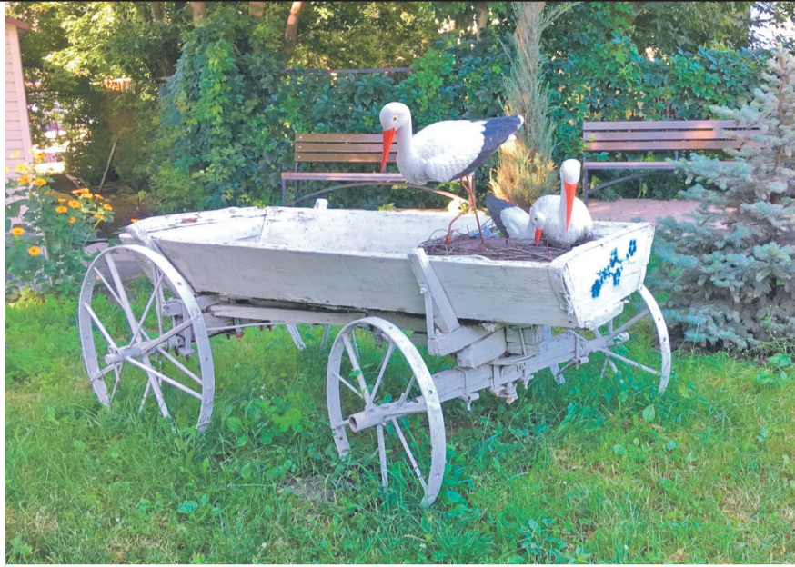
Центр образования № 1 г. Белгорода