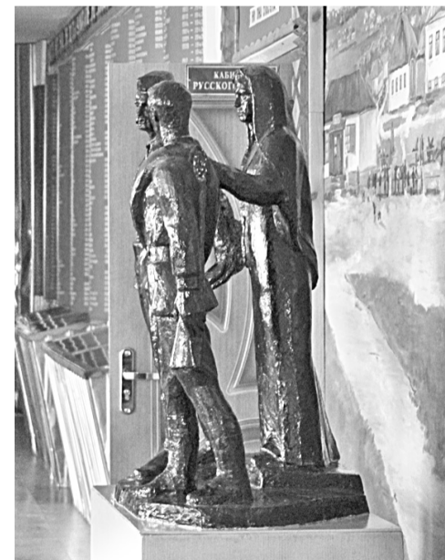
Школьный музей Великой Отечественной войны

Уверена в том, что в школе всегда ведущей и главной должна быть функция воспитания, ответственности за формирование человеческой личности. В детях необходимо формировать нравственные принципы, делая это незаметно и каждодневно. В нашей школе детей и педагогов связывают