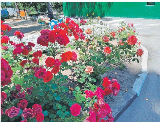
Детсад № 48 «Вишенка» г. Белгорода