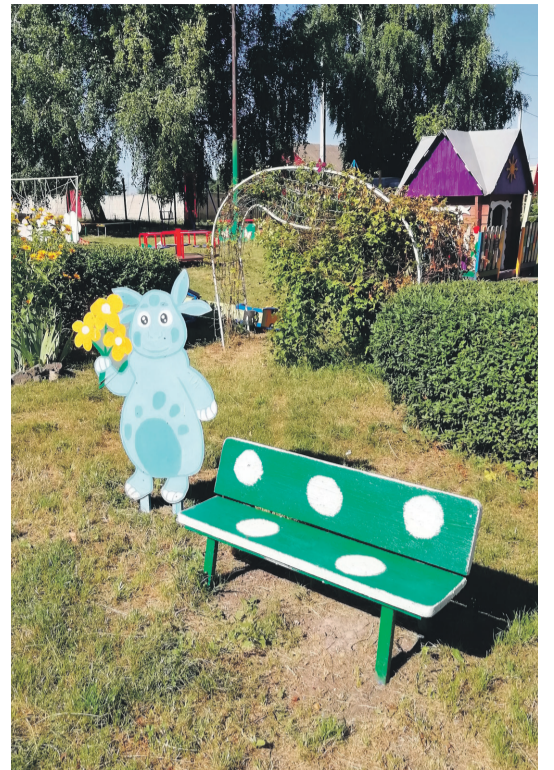
Детсад № 4 с. Алексеевка Корочанского района