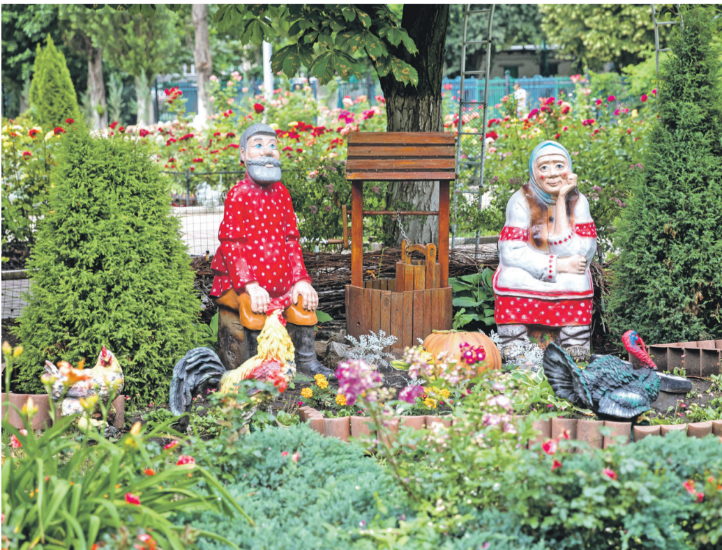
Школа № 41 г. Белгорода