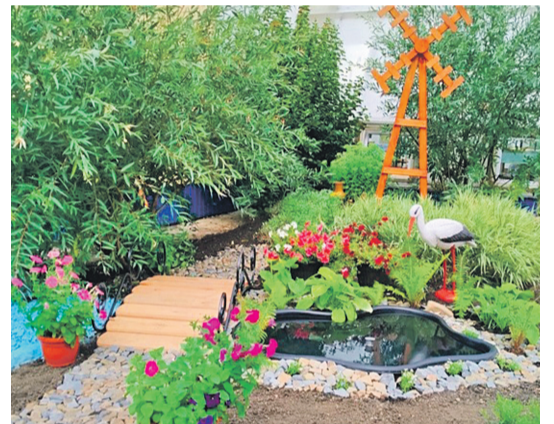
Рождественская школа Валуйского городского округа