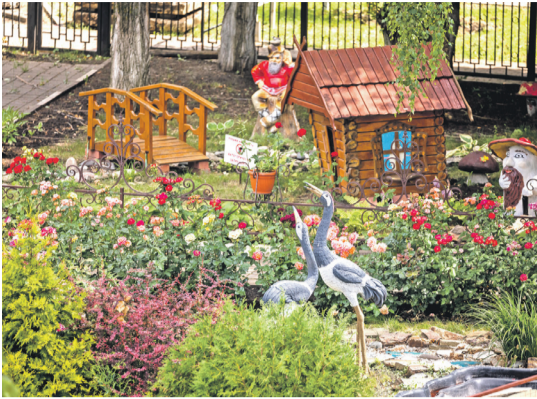
Школа № 41 г. Белгорода