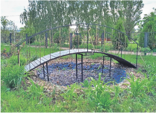
Уразовская школа № 2 Валуйского городского округа