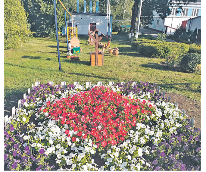
Старобезгинская школа Новооскольского городского округа