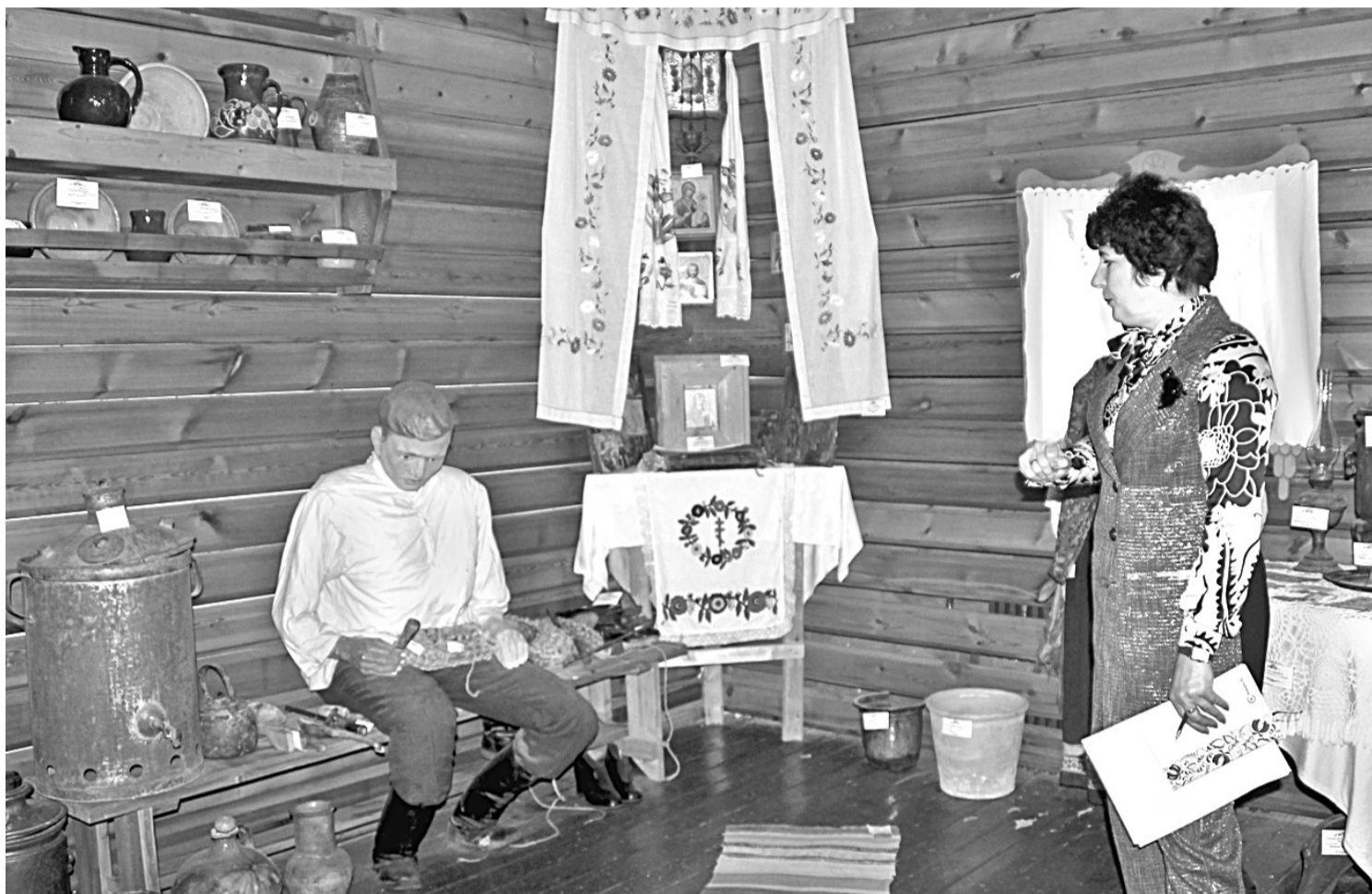
В школьном музее этнографии

НО ДАЖЕ САМОЕ КРАСИВОЕ, ПУСТЬ И ДОБРОЖЕЛАТЕЛЬНОЕ ОФОРМЛЕНИЕ МОЖЕТ СТАТЬ БЕСПОЛЕЗНЫМ, БЕЗДЕЙСТВЕННЫМ,