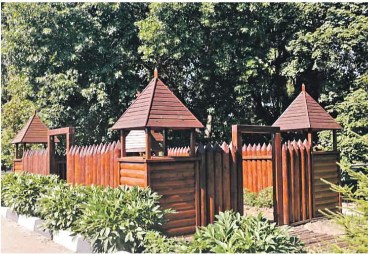
Школа № 4 г. Валуйки