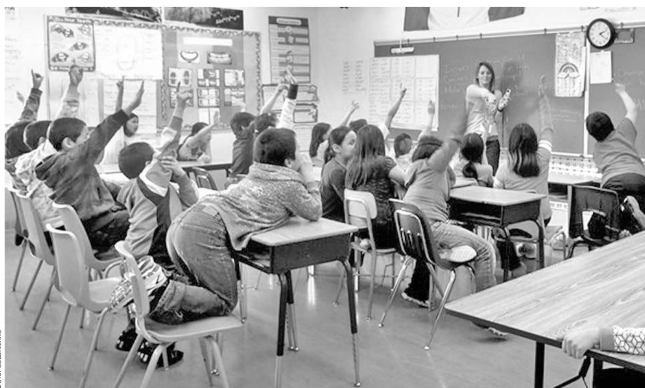
Занятия в одной из канадских школ