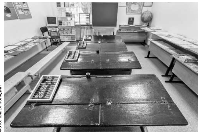
Зал истории образования в музее Томаровской школы № 1

С тех пор все уроки русского языка, литературы и беседы о советском обществе проходили без курьёзов. Молодёжная учительница даже съездила в областное управление кинофикации. Договорилась каждую неделю по пятницам привозить в колонию фильмы.