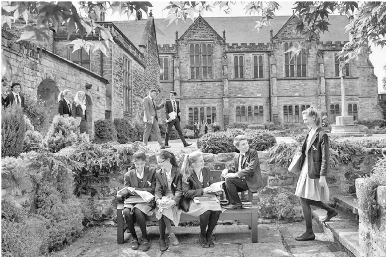
В некоторых канадских школах от формы и не думали отказываться