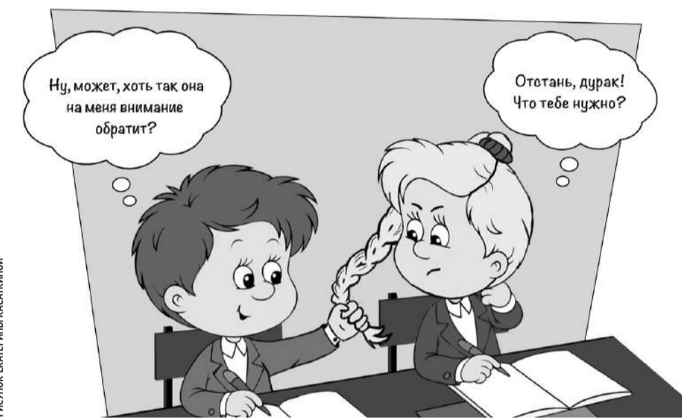
РИСУНОК ЕКАТЕРИНЫ КАСАКИНОЙ

Наши подростки переживают чувства влюблённости, первой любви, дружбы — это прекрасные человеческие чувства и отношения,